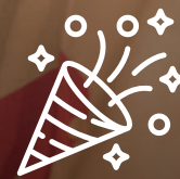
Salle de fête