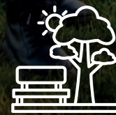
Espaces d'activités extérieures