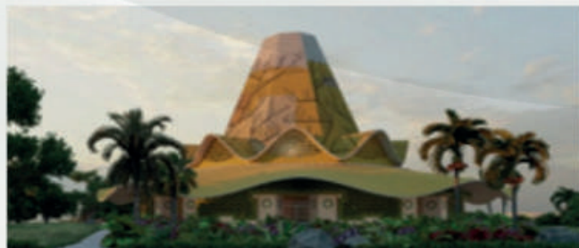
Baha'i Temple kinshasa