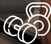
Salle de sport