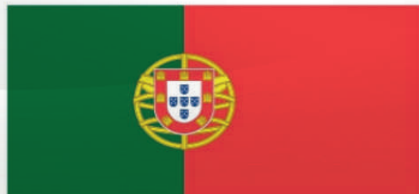
Ecole Portugaise de kinshasa